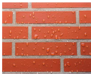
0602 TM-08 13 EW_JEn_Ke